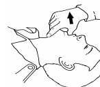
Soulèvement du menton